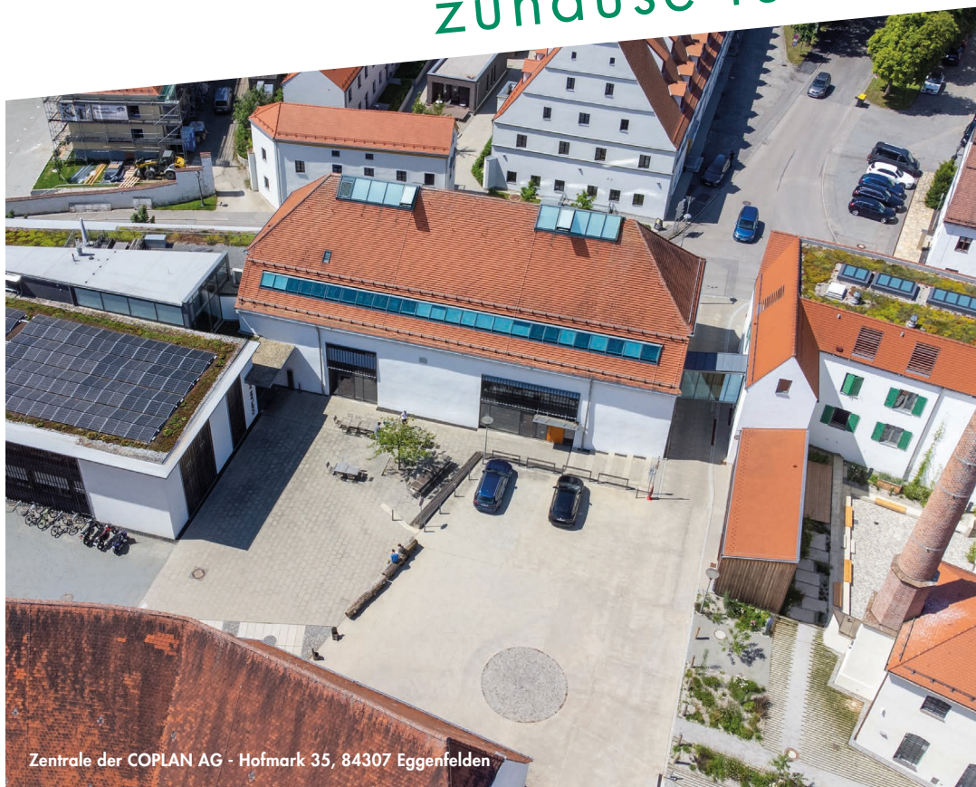
Zentrale der COPLAN AG - Hofmark 35, 84307 Eggenfelden